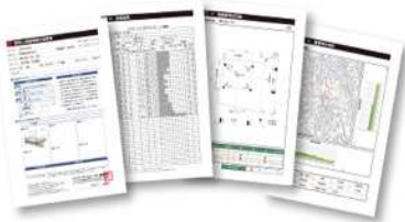
地盤調査データ (要 現場カラー写真)